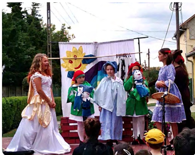
A Dimitrifjak Gyermekek Színjátszó csoport előadása

A rendezvényről a 4. oldalon olvashatnak Képek Irinyis közreműködőkkel