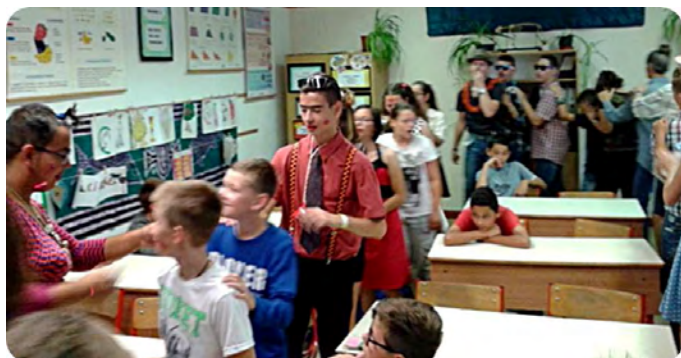
Már csak emlék... Bolond ballagás

Végzős diákjaink idén is bolondballagó előadással, majd szerenáddal köszöntek el első körben iskolánktól és a vértesi közösségtől az utolsó tanítási napon.